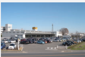
群馬県伊勢崎市本社